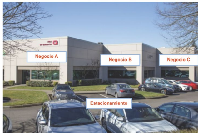
Figura 1: Centro comercial

Si un participante desea completar varios proyectos de iluminación en un sitio o desea completar un proyecto en varias fases, los incentivos totales para todos los proyectos y fases no pueden exceder el límite anual de iluminación del sitio de $750,000.