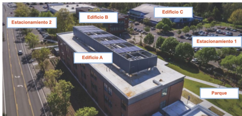
Figura 2: Campus corporativo

Alternativamente, si tres espacios comerciales están vacíos y el propietario desea actualizar las luces en todos ellos, se consideraría un participante. Todo el centro comercial se consideraría como un solo proyecto con un límite de proyecto de $750,000.