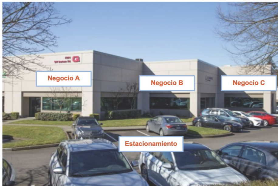
Figura 1: Plaza comercial

Los sitios comerciales se definen como: Propiedades existentes que no sean residencias unifamiliares, de uso industrial o agrícola. Las propiedades multifamiliares y las carreteras se consideran comerciales.