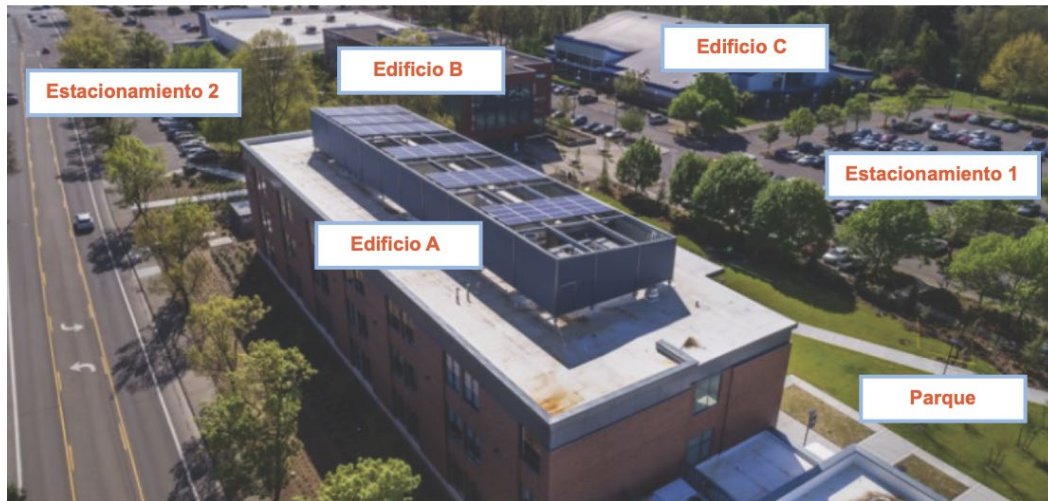
Figura 2: Campus corporativo

La Figura 2 muestra un campus comercial corporativo. En este caso, el campus completo es considerado una ubicación con el mismo participante, y como tal, está sujeto a un límite de $499,000 $750,000 .