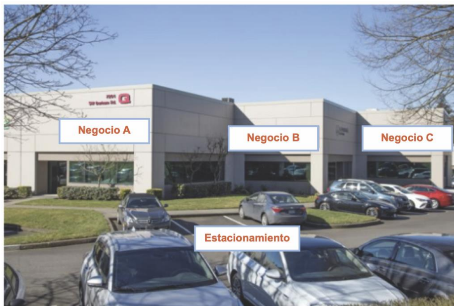
Figura 1: Plaza comercial

Los sitios comerciales se definen como: Propiedades existentes que no sean residencias unifamiliares, de uso industrial o agrícola. Las propiedades multifamiliares y las carreteras se consideran comerciales.